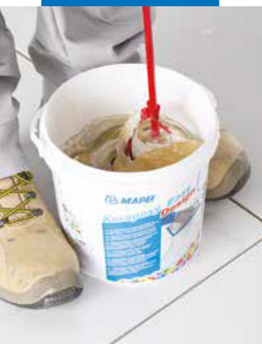
Перемешайте компоненты (А+В)

Moonlight (платина), Sahara (золото), Shining (серебро), Red Clay (медь), Stardust (темное серебро). Для получения однородной смеси мы предлагаем добавлять Mapecolor Metallic желаемого цвета в Kerapoxy Easy Design 700 (полупрозрачный).