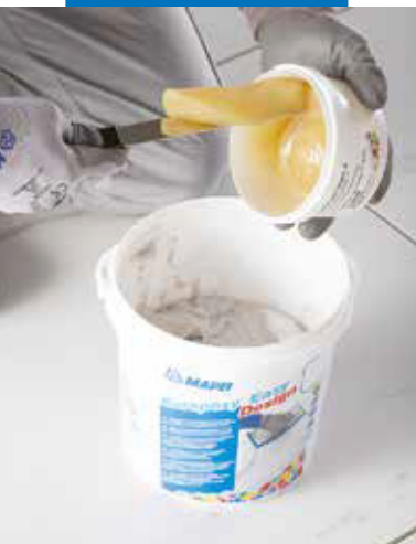
Переложите отвердитель (компонент В) в емкость с компонентом А