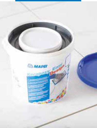
Двухкомпонентный шовный наполнитель, поставляемый в ведрах с компонентами А и В